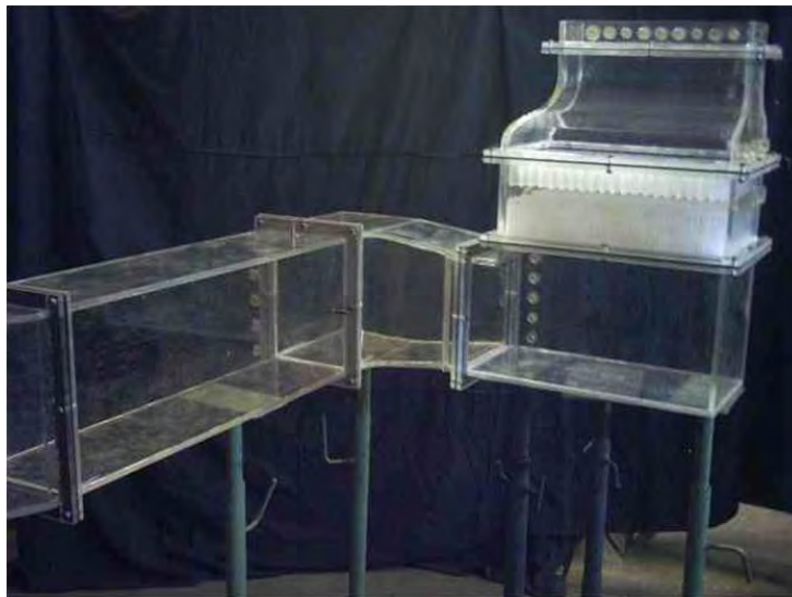
Рис.3. Аэродинамическая модель воздуховода ГТЭ-110 Ивановской ГРЭС

Для экспериментальной отработки аэродинамики воздуховода ГТЭ-110 в ОАО «НПО ЦКТИ» в 2005 г. была изготовлена модель из оргстекла с соблюдением полного геометрического подобия в масштабе 1:20 (рис. 3). Она была установлена на стенде ОАО «НПО ЦКТИ» и оснащена измерительными приборами. В местах расположения контрольных сечений модели производились измерения статических и динамических давлений в потоке. В результате эксперимента были получены потери полного давления воздуховода ГТЭ-110, равные 431 Па [3].